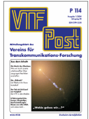
P 114, Nr. 1/2004